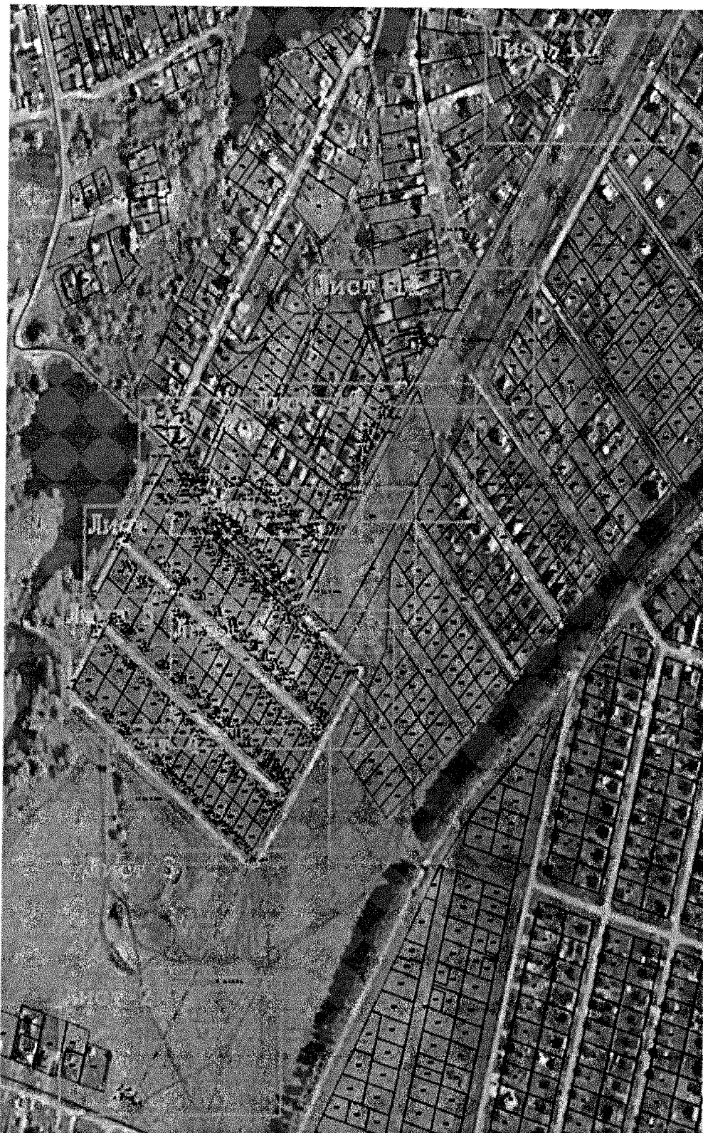
Масштаб 1:5 700

Подпись _____ Дата « _____ » _____ 20 _____ г.